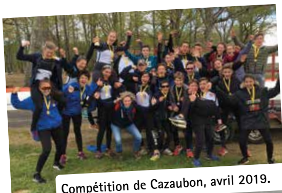
Compétition de Cazaubon, avril 2019.

La prise de licence au sein de la section leur donne également accès aux entraînements le mercredi après-midi et le samedi matin, au sein du club, afin de progresser davantage et de se perfectionner.