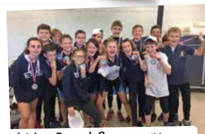
Compétition Rame à Carcassonne, classe de 5 e , juin 2018.