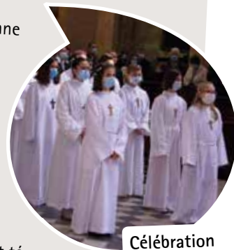
Célébration sacrements du 12 juin.