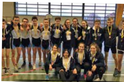
Compétition de Fenouillet, décembre 2017.