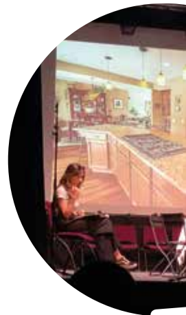
Com L'en Céc