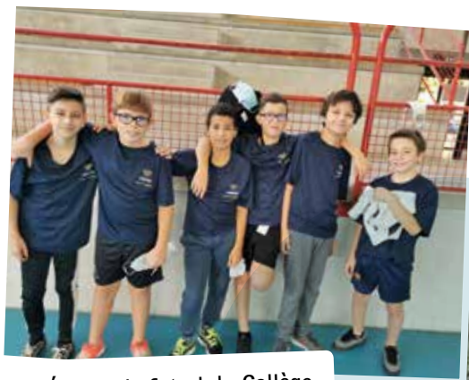
Équipe de futsal du Collège.