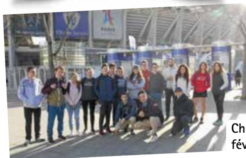
Championnat de France Indoor Paris, février 2017 et 2019.