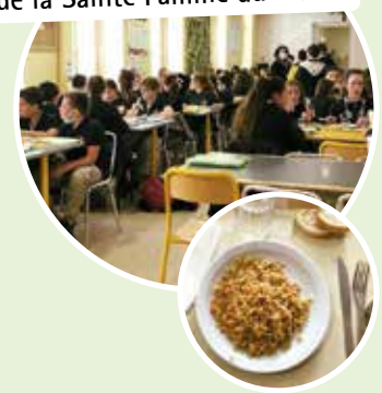
Bol de riz au profit de la Sainte Famille du Liban.