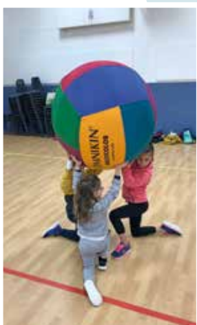
Initiation de kinball et de handball pour les élèves de Saint-Joseph à Saint-Nicolas-de-la-Grave.