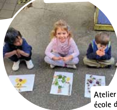
Atelier APC, école de Moissac.