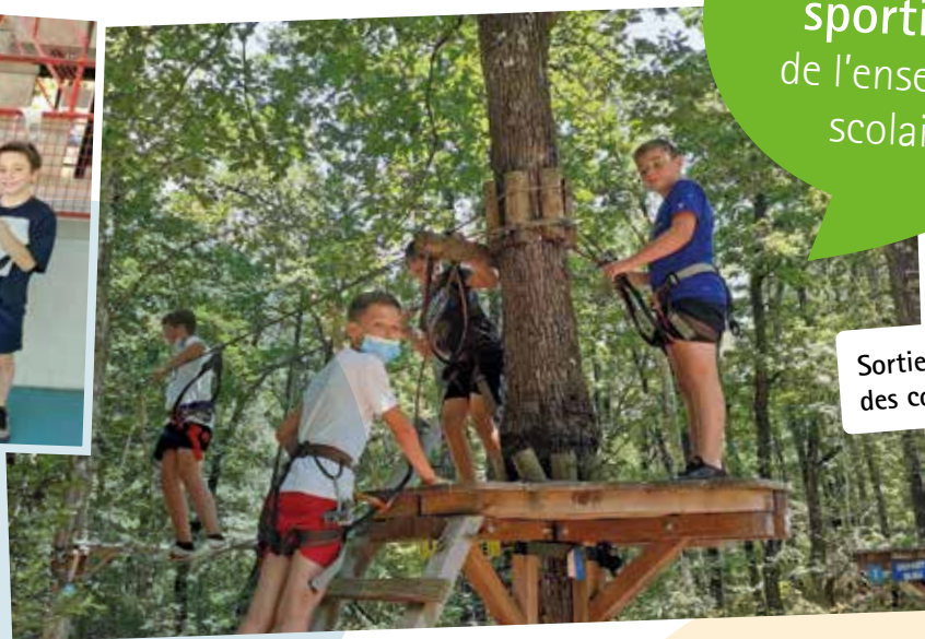
Sortie accrobranche des collégiens.