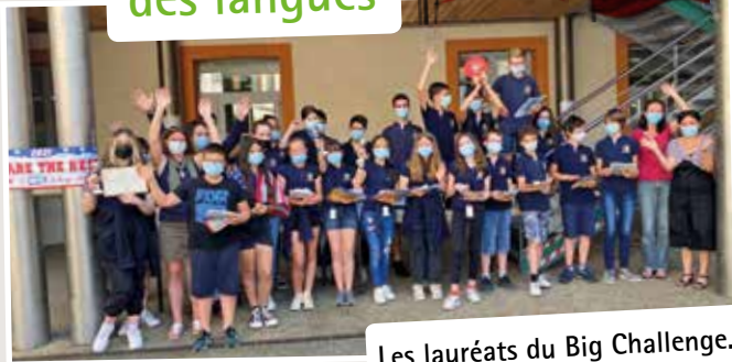
Les lauréats du Big Challenge.

Les langues vivantes (espagnol et anglais) sont pratiquées par tous les élèves de l'ensemble scolaire La Sainte Famille, de la petite section de maternelle à la 3 e .