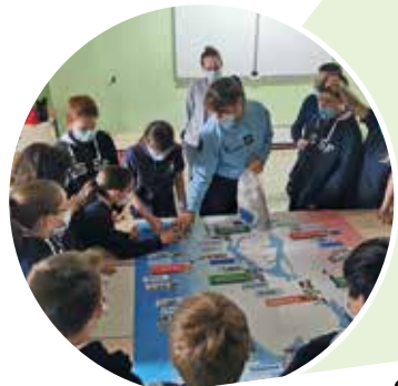
Parcours citoyen pour la classe CDSG (classe défense et sécurité globale).