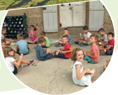
Fête de sainte Émilie à l'école de Saint-Nicolas-de-la-Grave.