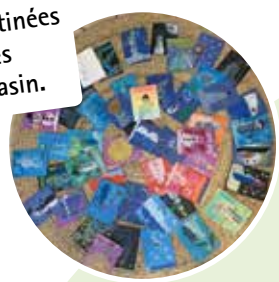
Cartes de vœux destinées aux personnes âgées école de Castelsarrasin.