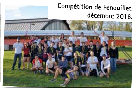
Compétition de Fenouillet, décembre 2016.