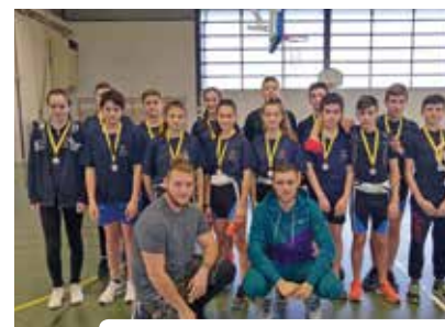
Compétition de Fenouillet, décembre 2019.