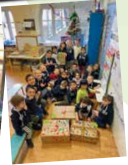
Les élèves de la maternelles à la 3 e de Moissac ont participé à la confection de colis solidaires offerts aux personnes défavorisées. Ces cadeaux ont été remis au Secours catholique.