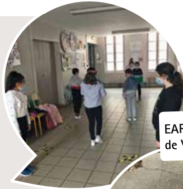
EAR à l'école de Valence-d'Agen.