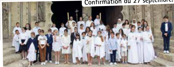
Confirmation du 27 septembre.