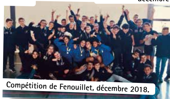
Compétition de Fenouillet, décembre 2018.