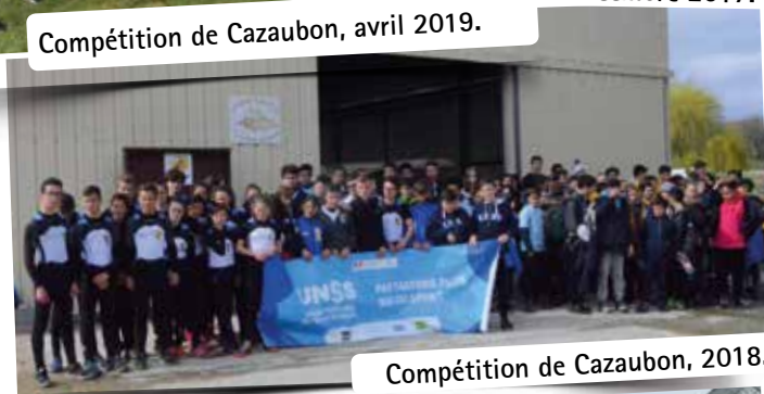
Compétition de Cazaubon, 2018.