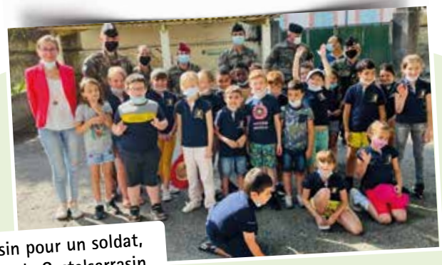
Dessin pour un soldat, école de Castelsarrasin.