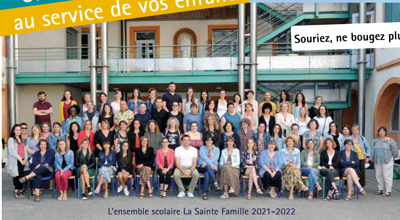
L'ensemble scolaire La Sainte Famille 2021-2022