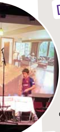
Comédie musicale, L'envol de la famille Cécité .

Depuis de nombreuses années, notre ensemble scolaire La Sainte Famille présente soit une comédie musicale soit une pièce de théâtre. Ils sont présentés tous les ans au Hall de Paris. Également, chaque année, des élèves d'établissements privés de Montauban et du collège La Sainte Famille de Moissac présentent un concert.